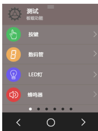
图 1.328 测试板载功能主页面

讲完了软件工程,接下来我们就将该工程下载至我们的A4开发板进行验证,首先我们需要在 Quartus II 软件中将 Qsys_Finish.sof 下载至我们的 A4 开发板, Qsys_Finish.sof 下载完成后, 我们还需要在 Eclipse 软件中将 Qsys_Finish.elf 文件下载至我们的 A4 开发板, Qsys_Finish.elf 下载完成以后, 我们的 C 程序将会执行在我们的 A4 开发板上, 此时, 我们可以在 TFT 液晶屏中看到, 如图 1.328 所示页面