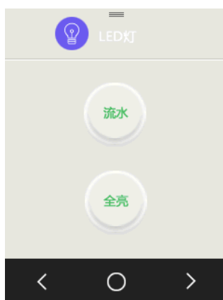
图 1.329 LED 测试页面

这时, 我们点击 LED 灯, 进入 LED 测试页面, 如图 1.329 所示。